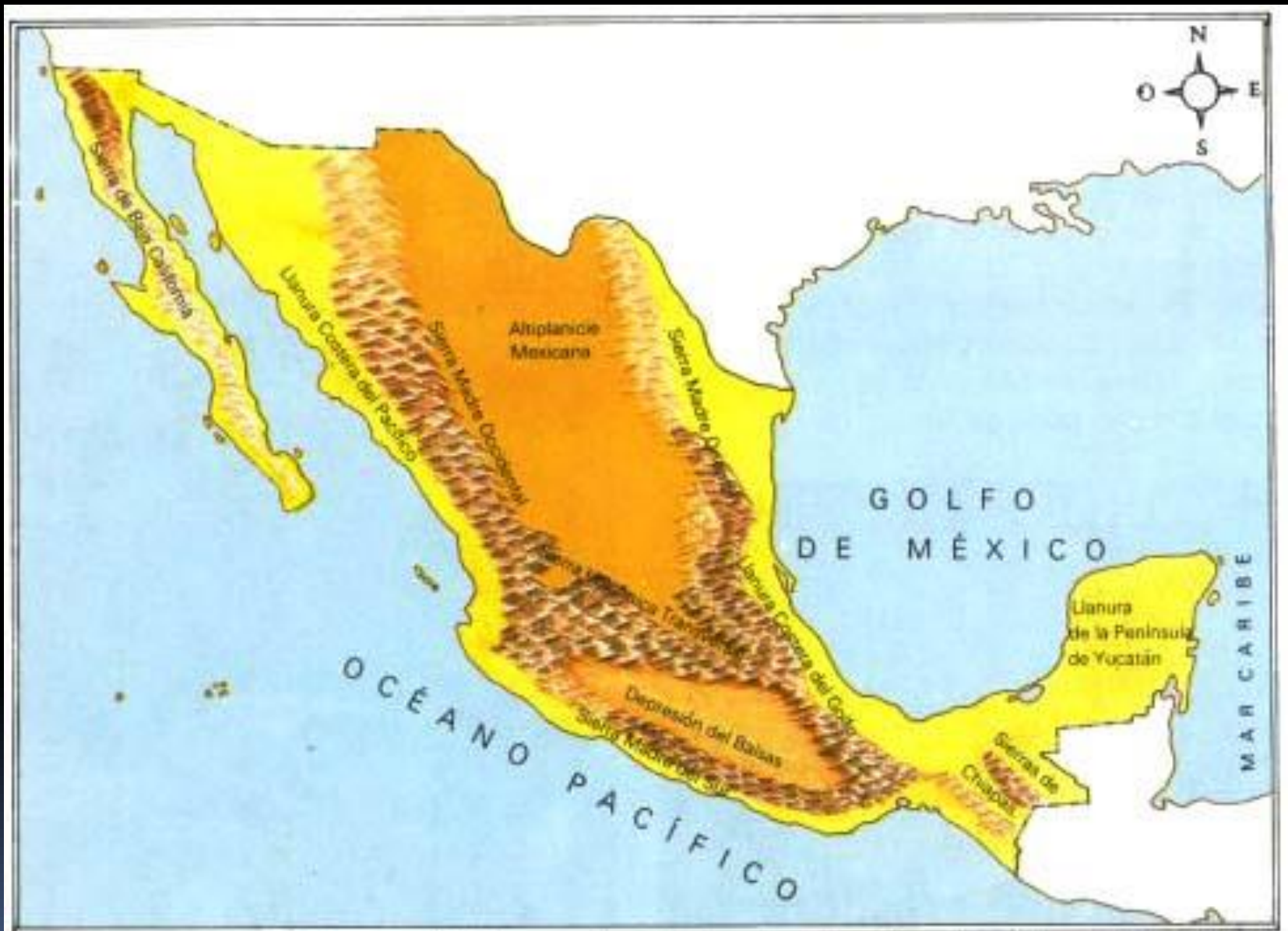
En este mapa aparecen las formas del relieve en el territorio nacional. Los diferentes relieves están señalados